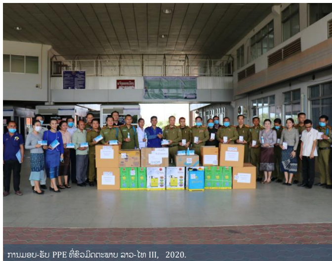
ການມອບ-ຮັບ PPE ທີ່ຂົວມິດຕະພາບ ລາວ-ໄທ III, 2020.