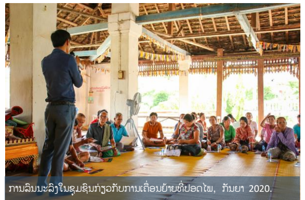
ການລົນນະລົງໃນຊຸມຊົນກ່ຽວກັບການເຄື່ອນຍ້າຍທີ່ປອດໄພ, ກັນຍາ 2020.