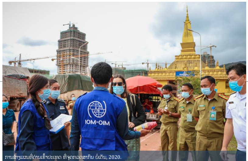
ການສ້າງແຜນທີ່ດ່ານເຂົ້າປະເທດ ທີ່ຈຸດກວດສາກົນ ບໍ່ເຕີນ, 2020.