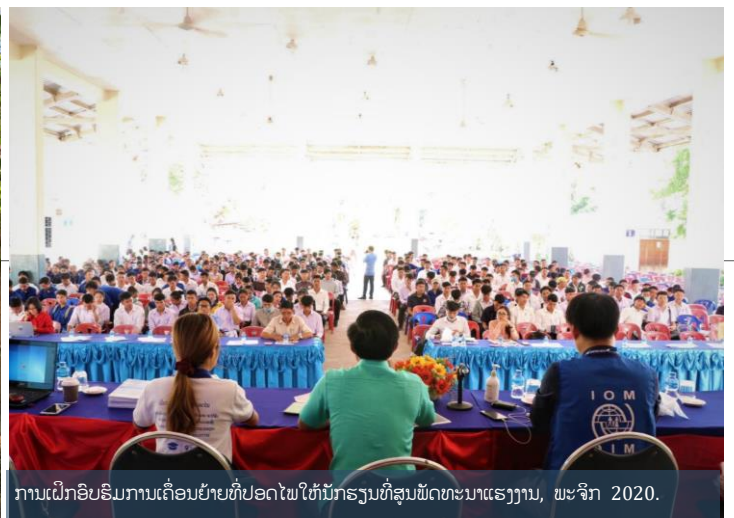
ການເຝິກອົບຮົມການເຄື່ອນຍ້າຍທີ່ປອດໄພໃຫ້ນັກຮຽນທີ່ສູນພັດທະນາແຮງງານ, ພະຈິກ 2020.