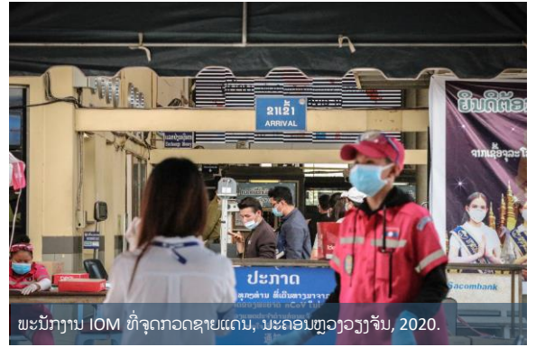
ພະນັກງານ IOM ທີ່ຈຸດກວດຊາຍແດນ, ນະຄອນຫຼວງວຽງຈັນ, 2020.