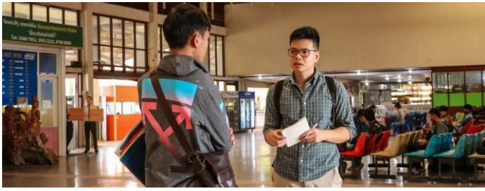
ສຳພາດຜູ້ເຄື່ອນຍ້າຍໃນຈຸດປ່ຽນເສັ້ນທາງສະຖານີລົດເມໃນນະຄອນຫຼວງວຽງຈັນ, ພະຈິກ 2020