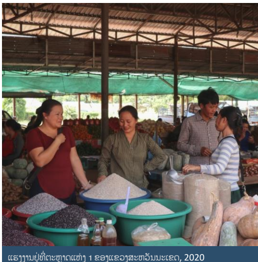
ແຮງງານຢູ່ທີ່ຕະຫຼາດແຫ່ງ 1 ຂອງແຂວງສະຫວັນນະເຂດ, 2020

259 ທ່ານໄດ້ເຂົ້າຮ່ວມໃນການປຶກສາຫາລືກ່ຽວກັບ SOP.