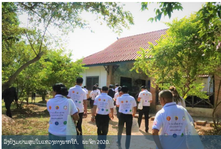
ລົງຢ້ຽມຢາມສູນໃນແຂວງທາງພາກໃຕ້, ພະຈິກ 2020.