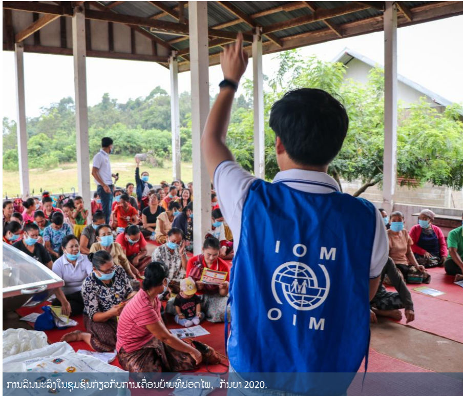
ການລົນນະລົງໃນຊຸມຊົນກ່ຽວກັບການເຄື່ອນຍ້າຍທີ່ປອດໄພ, ກັນຍາ 2020.